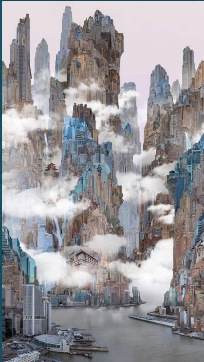
杨泳梁 Yang Yongliang 炮台公园 Battery Park 艺术微喷 Giclee Print on Fine Art Paper 100 x 178 cm 2024 版数 Edition: By Request