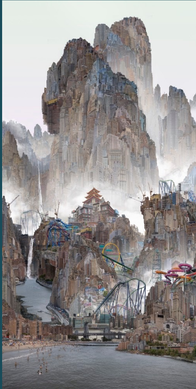
杨泳梁 Yang Yongliang 极乐岛 Coney Island 艺术微喷 Giclee Print on Fine Art Paper 100 x 200 cm 2024 版数 Edition: By Request