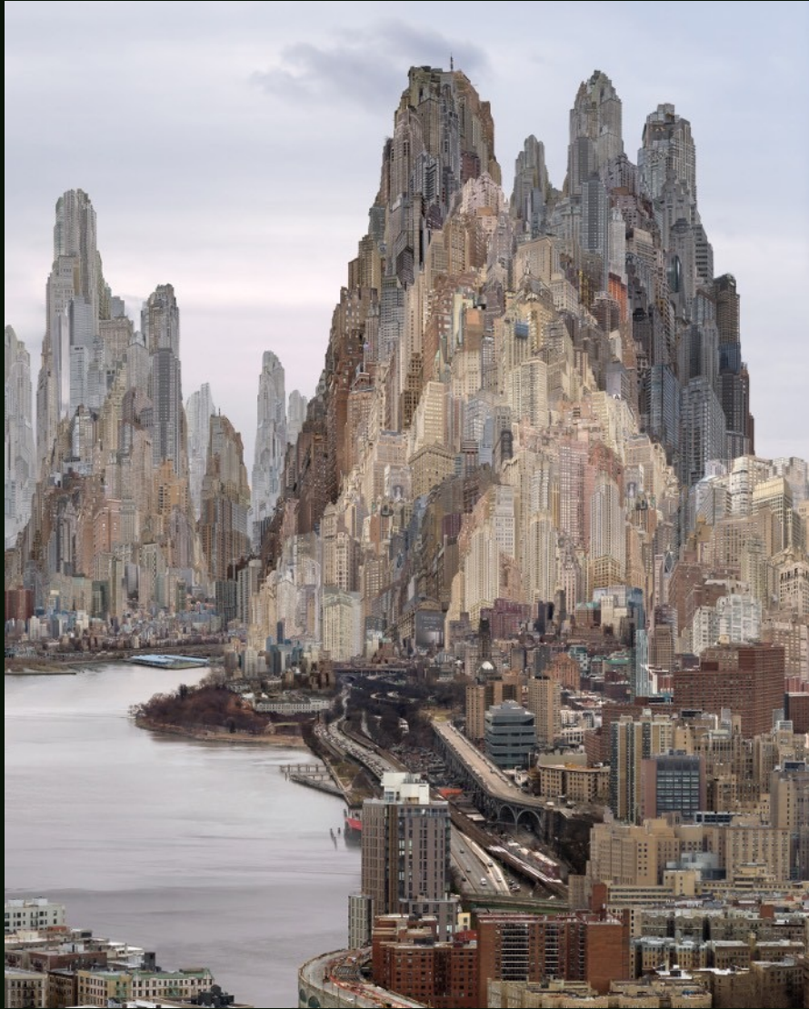
杨泳梁 Yang Yongliang 晨边 Morningside 艺术微喷 Giclee Print on Fine Art Paper 120 x 150 cm 2024 版数 Edition: By Request