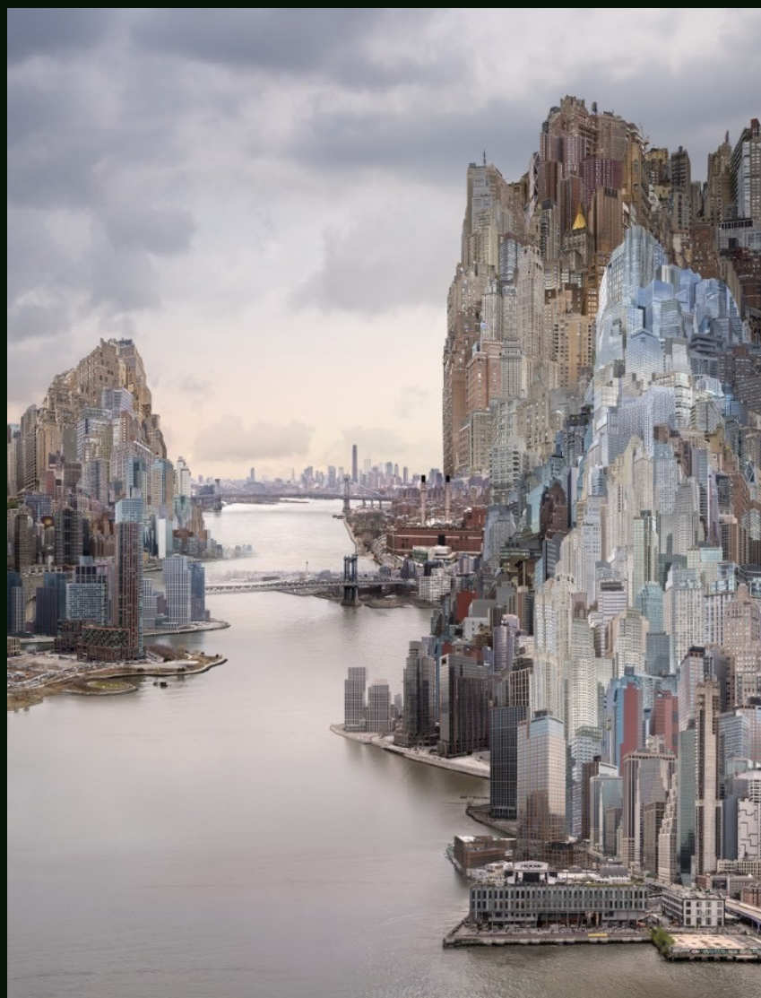
杨泳梁 Yang Yongliang 双桥 Two Bridges 艺术微喷 Giclee Print on Fine Art Paper 100 x 130 cm 2024 版数 Edition: By Request