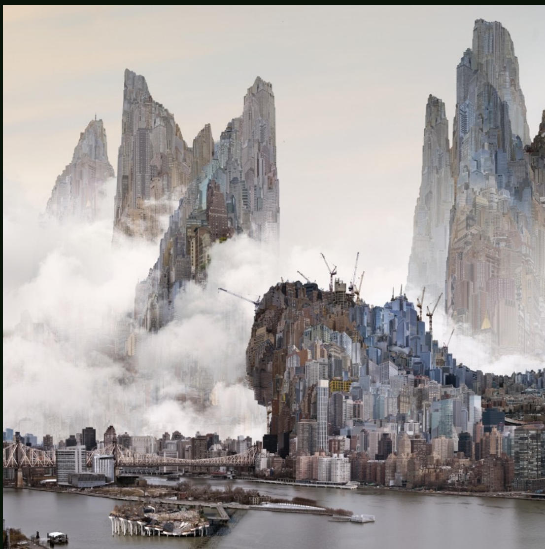
杨泳梁 Yang Yongliang 漂浮小岛 Little Island 艺术微喷 Giclee Print on Fine Art Paper 100 x 100 cm 2024 版数 Edition: By Request