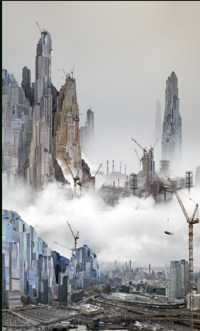
杨泳梁 Yang Yongliang 西区庭院 West Side Yard 艺术微喷 Giclee Print on Fine Art Paper 80 x 130 cm 2024 版数 Edition: By Request