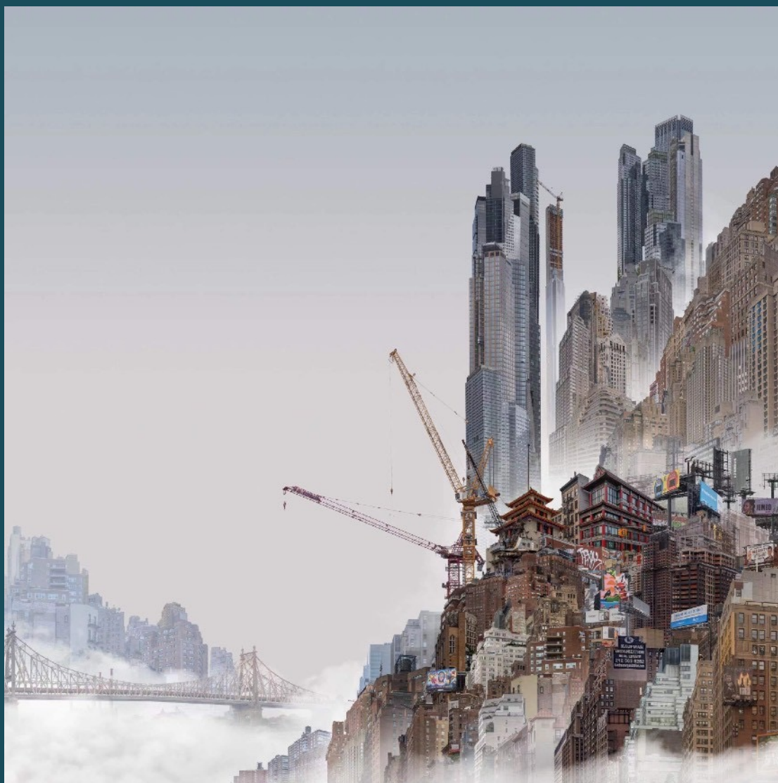
杨泳梁 Yang Yongliang 皇后大桥 Queensboro Bridge 艺术微喷 Giclee Print on Fine Art Paper 60 x 60 cm 2024 版数 Edition: By Request