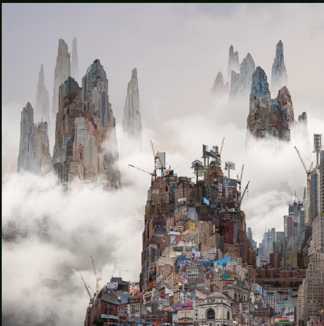
杨泳梁 Yang Yongliang 唐人街 Chinatown 艺术微喷 Giclee Print on Fine Art Paper 60 x 60 cm 2024 版数 Edition: By Request