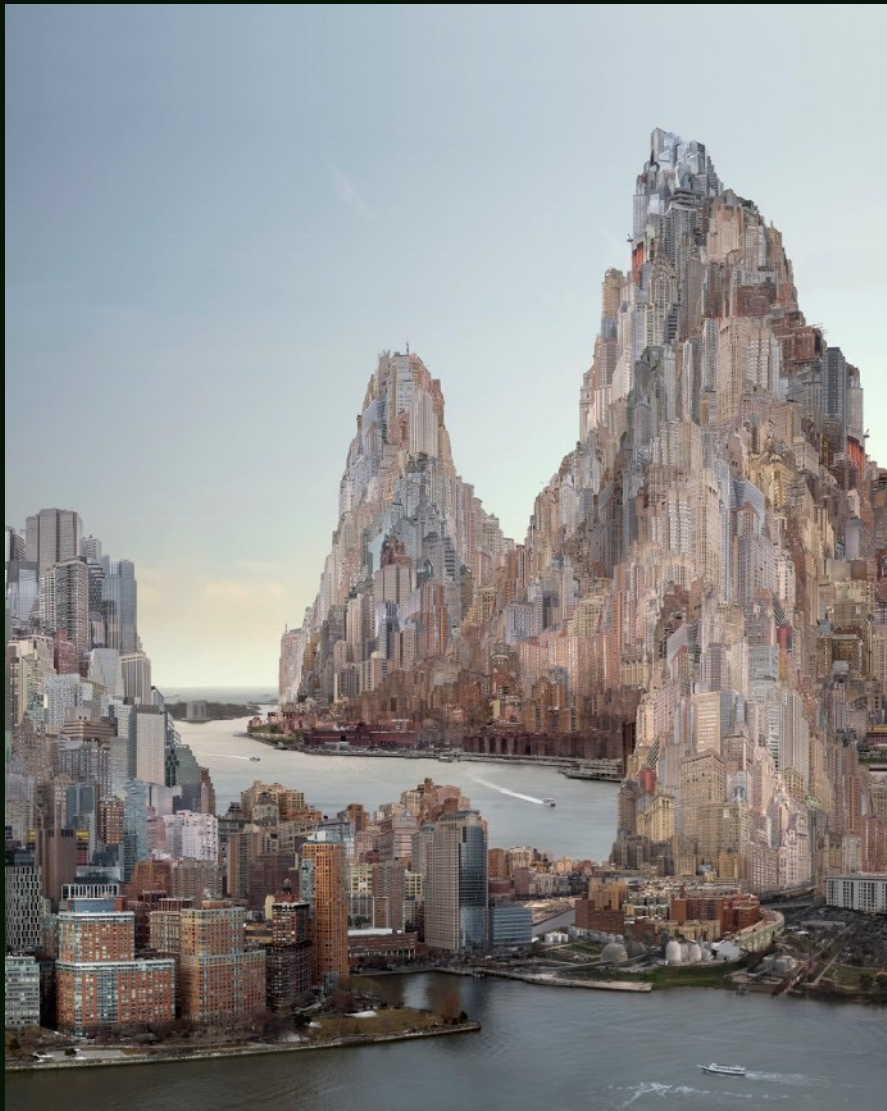
杨泳梁 Yang Yongliang 双河 Twin Rivers 艺术微喷 Giclee Print on Fine Art Paper 120 x 150 cm 2024 版数 Edition: By Request